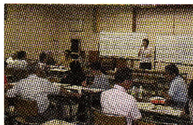
養成講座のようす