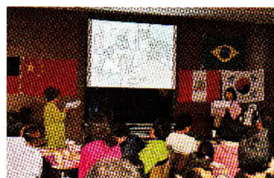
読み聞かせのようす