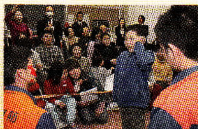
119番うまくかけられたよ

また、消防士の皆さんが救急車の模型を使った寸劇を上演し、楽しく親子で学ぶことも出来ました。