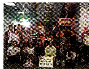
校外学習参加の皆さん

また、日本語教室では、校外学習として、10月16日(日)名古屋市港防災センターを訪問し、地震体験室で、震度6強の地震を体験したり、3Dで、伊勢湾台風の再現された映像を見るなど、自然災害の恐ろしさとその備えについて学びました。