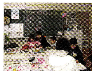
国際ルームのようす

外国籍の児童・生徒が、日本語の学習や文化、習慣に早く慣れることができるよう、国際交流協会では、平成18年度から「子ども塾」を実施しています。ふくらの家の「子ども塾」に加えて、9月から、藤里小学校の空き教室を整備した「国際ルーム」で教室を開催しています。新しく、広い教室で、ボランティアの皆さんとともに、子どもたちが、楽しく元気いっぱい勉強しています。