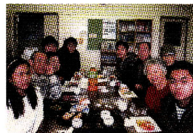
日曜日教室の皆さん

この教室では、現在ベトナムや中国からの研修生や学生、さらには、タイやフィリピンからの女性など11人が参加しています。職業やレベルは、まちまちですが、学習者の希望やレベルに合わせて、マンツーマンやグループ方式で、毎週、午後1時から途中でティータイムを挟み、午後3時過ぎまで学んでいます。ティータイムでは、なるべく身近な話題を取り上げ、間違ってもいいからと自由な会話を楽しんでいます。日本語を学びたい外国の方がいらっしゃれば、教室を紹介してください。