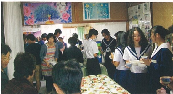
「多文化プラザ」オープニング。 みんなでクッキングを楽しみました。

江南市国際交流協会では、現在、市内の中心部にある民家を活用した「ふくらの家」を活動拠点に、ボランティアが中心となって、市内在住外国人の方と一緒に、市民の皆さんの国際理解と多文化共生のまちづくりの推進のため、様々な活動をおこなっています。当協会では、更に活動の幅を広げるため、2018年10月17日に「ふくらの家」の近隣にある空き家を「多文化プラザ」としてオープンしました。多文化共生やボランティア活動に興味のある方は是非遊びに来てください！