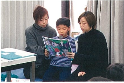
世界の紙芝居 中国の紙芝居「歯のないトラ」 12月8日 江南市立図書館