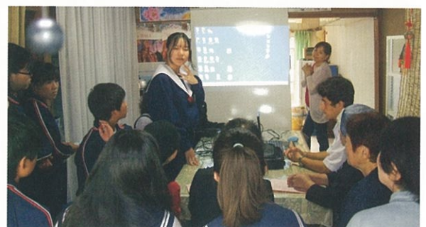
北部中学校の職場体験学習生徒や尾北高校の留学生の皆さんもオープニングをお祝いしてくれました。