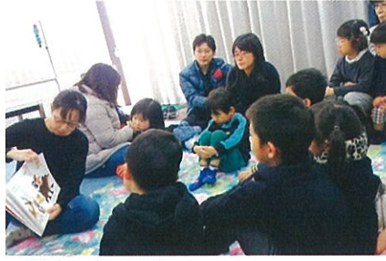
おはなし広場 英語でおはなし会「ももたろう」 1月26日 江南市立図書館