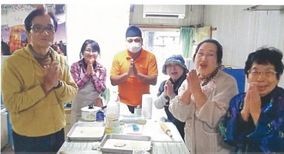
「わいわいプラザ交流会」 毎月、外国の料理の会を開き、地域のみなさんとの交流を深めています。