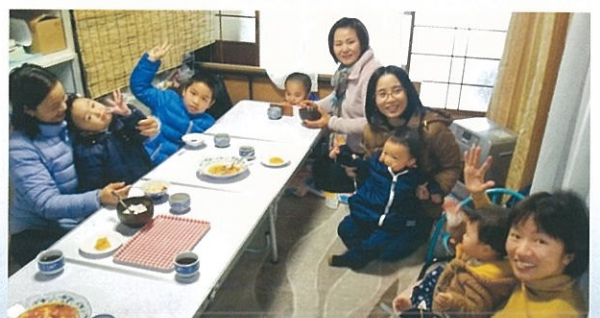
「多文化子育てサロン」 子育て中や妊娠中の人達が、毎週火曜日に集まって楽しんでいます。