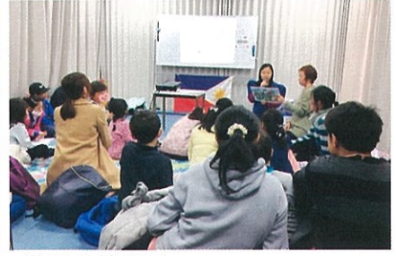
世界の紙芝居 フィリピンの紙芝居「さるとわに」 2月9日 江南市立図書館