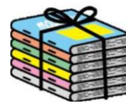
Papeles de gran tamaño